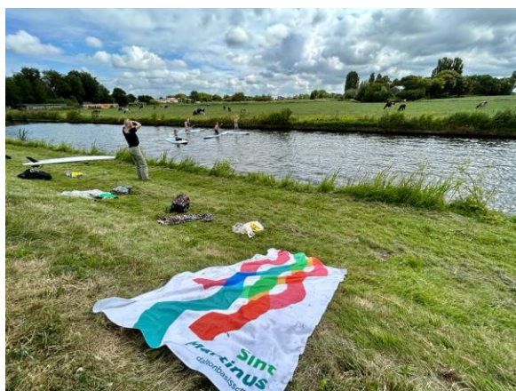
De zeedijk in Makkum

Het eerste strandlaken is al gespot tijdens het suppen met groep 5-6 en 7-8.